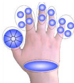
Figure 4: Les zones associées à chaque commande accessibles par les différents doigts. Ainsi que la zone d'activation du menu.

Le MultiTouch menu possède également un mode expert qui permet aux utilisateurs de sélectionner des commandes sans afficher le menu. Comme pour les Marking menus [7], un délai de 0.3s est utilisé après l'activation du menu avant de l'afficher. Cependant, en plus de considérer la capacité des utilisateurs à facilement discrétiser différentes orientations, le MTM considère la capacité des utilisateurs de différencier leurs doigts. En effet, il nous semble facile d'associer une commande à chaque doigt. Nous prévoyons à court terme d'étudier les apports de ce nouveau type d'association "entrée/commande" dans une tâche d'apprentissage et de mémorisation.